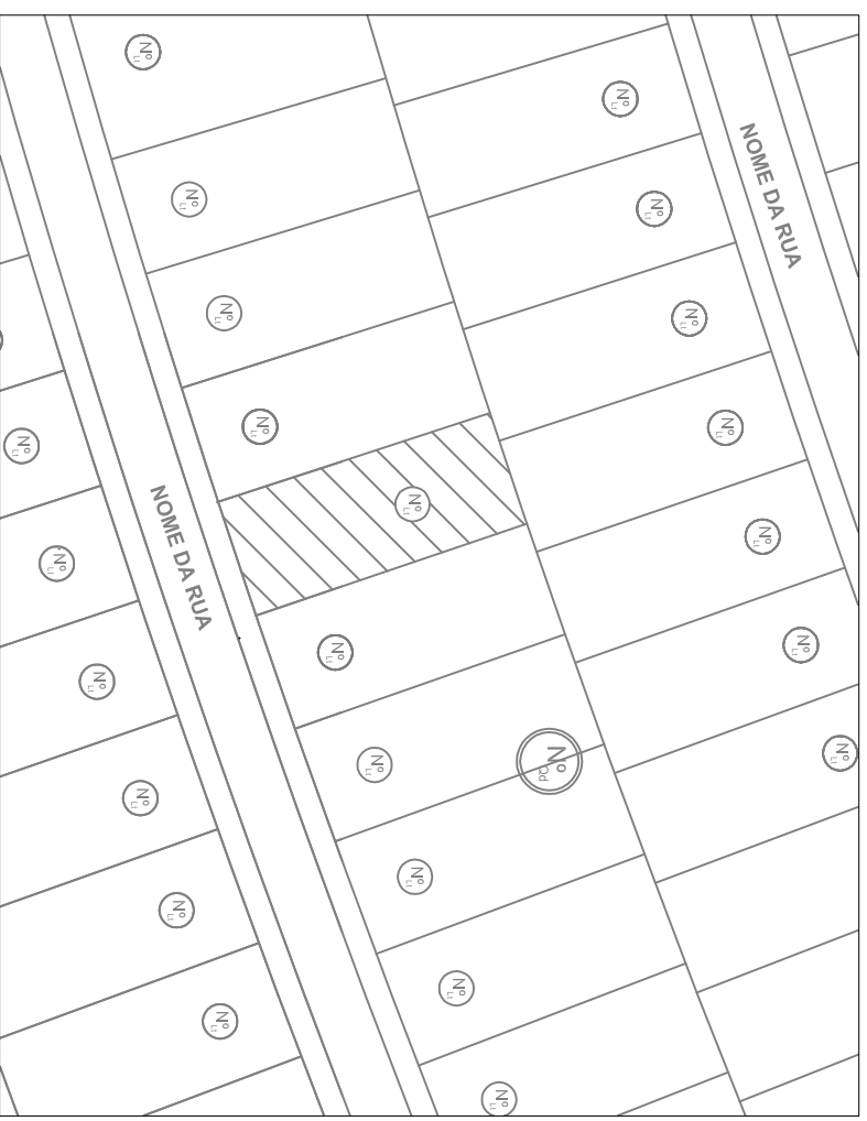
PLANTA LOCAÇÃO S/ ESCALA