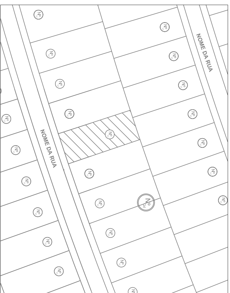
PLANTA LOCAÇÃO S/ ESCALA

NORTE DECLINAÇÃO MAGNÉTICA EM 2005 E CONVERGÊNCIA MERIDIANA NO CENTRO DA FOLHA DATUM VERTICAL IMBITUBA - SC DATUM HORIZONTAL - SAD 69 MC = -33° WGr.